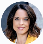
Mona Vetsch Moderation