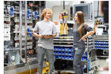
ABB Turgi ist globales Kompetenzzentrum für Leistungselektronik – von Forschung und Entwicklung bis Fertigung und Service, alles unter einem Dach. Mit rund 1500 Mitarbeiter:innen bietet der Standort energieeffiziente Lösungen für Bahn, Industrie und Infrastruktur. Hier erleben die Teilnehmer:innen eine Tour zu Hochleistungsantrieben, mit denen ABB einen Beitrag leistet, um Nachhaltigkeit in den Zukunftsmärkten Mobilität, Industrie und erneuerbare Energien zu steigern.